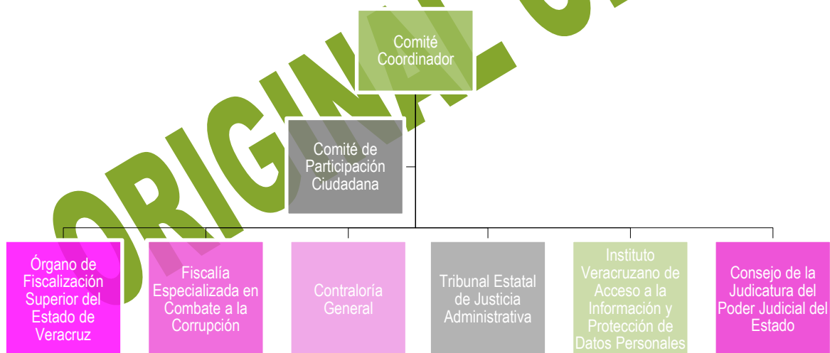
Ilustración Número 1 Estructura del Comité Coordinador del Sistema Estatal Anticorrupción

Fuente de información: Artículo 10 de la Ley del Sistema Estatal Anticorrupción de Veracruz de Ignacio de la Llave.